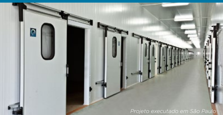
Projeto executado em São Paulo