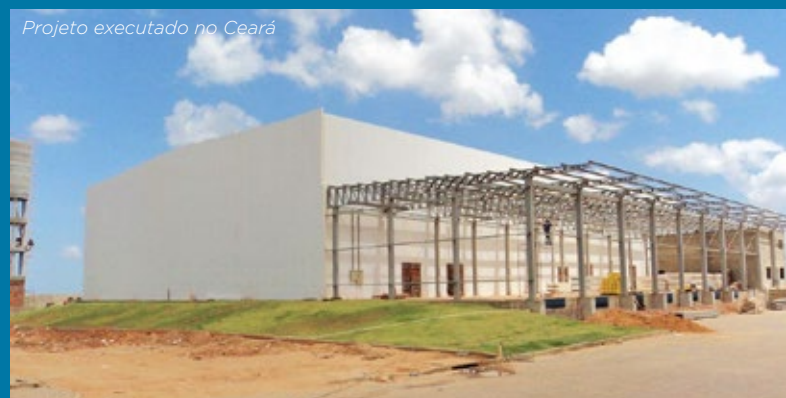
Projeto executado no Ceará

Orçamentos através do site ou diretamente nas filiais da Frigelar em todo Brasil